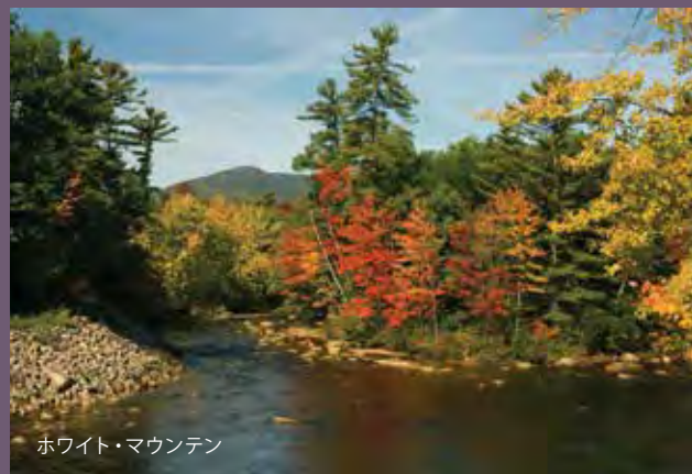
ホワイト・マウンテン